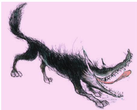
Peter und der Wolf

Eintritt für Schulklassen nach Anmeldung frei