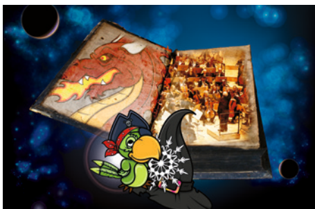
Kids' Night – Filmmusik Highlights für Familien

*Open-Air-Ticket inkl. Sitzplatz im Konzertsaal bei widrigen Witterungsbedingungen