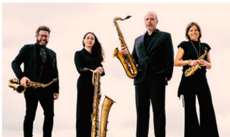
Raschèr Saxophone Quartet