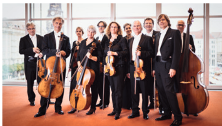
Philharmonisches Kammerorchester Dresden