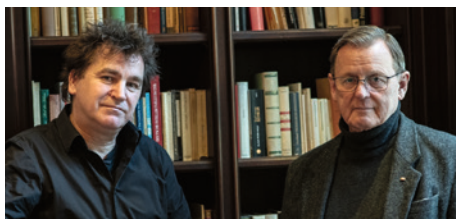
Ilko-Sascha Kowalczyk und Bodo Ramelow