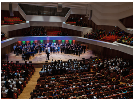
Dresdner Chortag im Kulturpalast