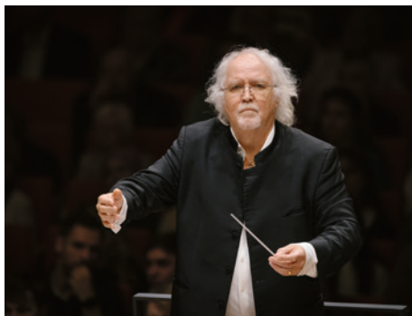
Sir Donald Runnicles