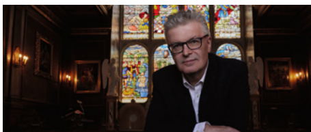
Sir James MacMillan