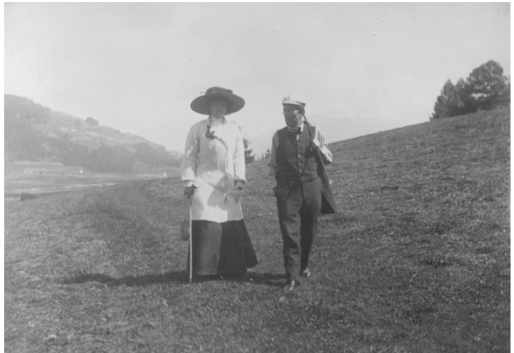
Gustav und Alma Mahler 1909 bei Toblach

Gustav Mahler wurde sein Leben lang, selbst in frohen Zeiten, von tiefsitzenden Ängsten und dunklen Ahnungen geplagt – kein Wunder angesichts seiner wenig glücklichen Kindheit und des frühen Todes mehrerer Geschwister.