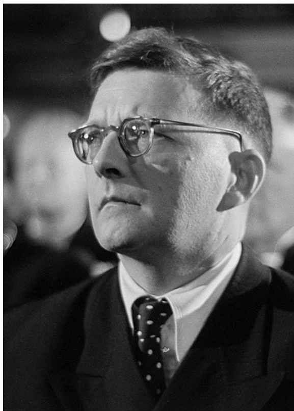
Dmitri Schostakowitsch, 1950

Wie frei ist ein Künstler in einem totalitären Regime? Kann er überhaupt ausdrücken, was ihm wichtig ist? In einer Diktatur sind auch Künstler nicht vor den Gefahren von Gewalt und Unterdrückung sicher. Das gilt heute ebenso wie früher. Wenn Ideologen an der Macht sind, hat es die Stimme der Unabhängigkeit schwer. Doch wie reagieren, wenn man ständig Gefahr läuft, als Protestler, der nicht auf Parteilinie agiert, enttarnt zu werden? Es ist wie der Gang über ein Drahtseil – ein falscher Schritt, und man stürzt in den Abgrund. Kaum ein Komponist hat das im 20. Jahrhundert so unmittelbar erlebt wie Dmitri Schostakowitsch. »Wenn ich erfahre, dass jemand gequält wird, erfahre ich selbst den Schmerz. Ich habe auch Angst vor Schmerzen...«.