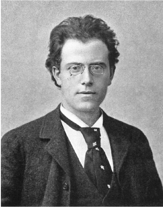
Gustav Mahler, 1892

ist er genauso kompromisslos wie als Dirigent. Nichts überlässt er dem Zufall, auf Bequemlichkeiten kann und will er keine Rücksicht nehmen. Widerspruch zwecklos!