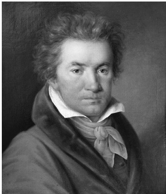
Ludwig van Beethoven, 1815

Wieder sind sie da, die Franzosen mit ihrem erobierungslustigen Kaiser Napoleon. Sie stehen vor und kurz danach in Wien. Gerade erst hat Ludwig van Beethoven ein neues Klavierkonzert abgeschlossen, als die Habsburger am 13. Mai 1809 kapitulieren. Neun Tage zuvor ist Beethovens guter Freund und Förderer, Erzherzog Rudolph, ein begabter Pianist,